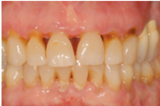
Abb. 1: Die Parodontitis führt zu einem stetigen und irreversiblen Abbau des Zahnhalteapparates.